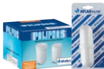
POLIPHOS A НАПОЛНИТЕЛЬ ДЛЯ DOSAPLUS 2-3-4